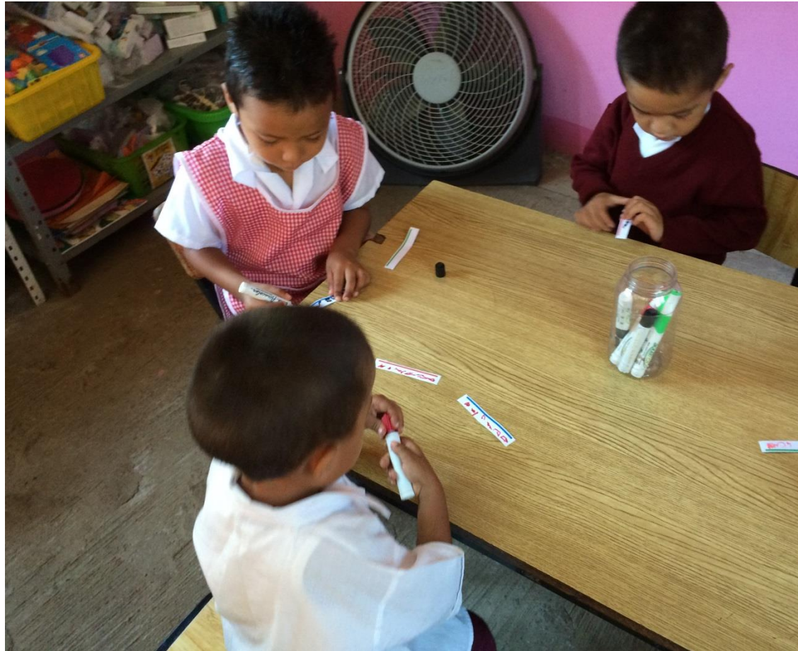
Escribiendo su nombre en etiquetas para marcar sus pertenencias