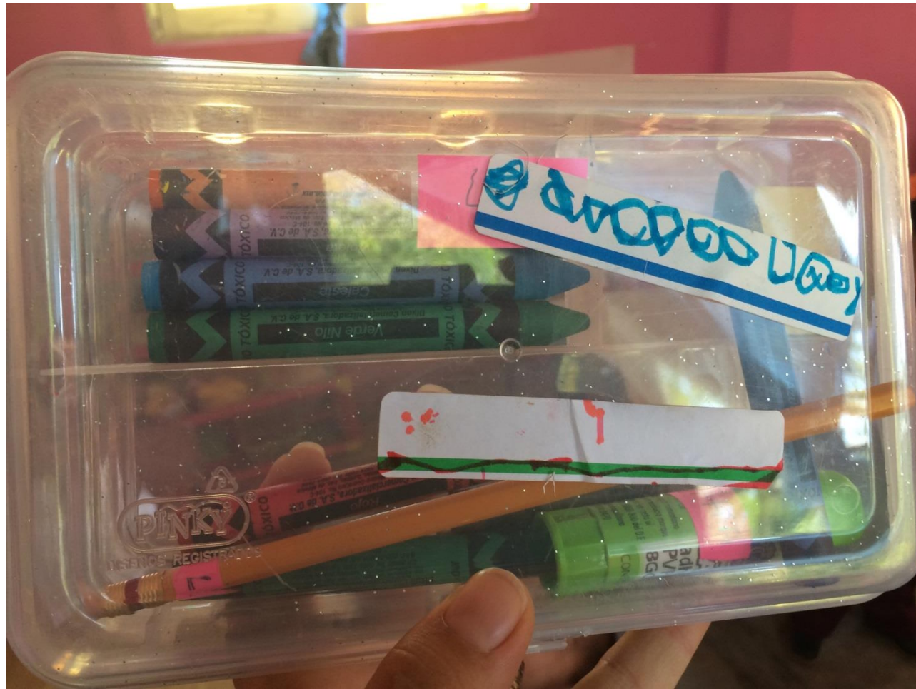
Marcando sus pertenencias con las etiquetas elaboradas