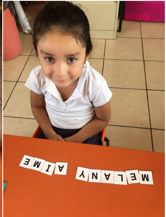
FORMACIÓN SU NOMBRE (ALFEBTO MOVIL)