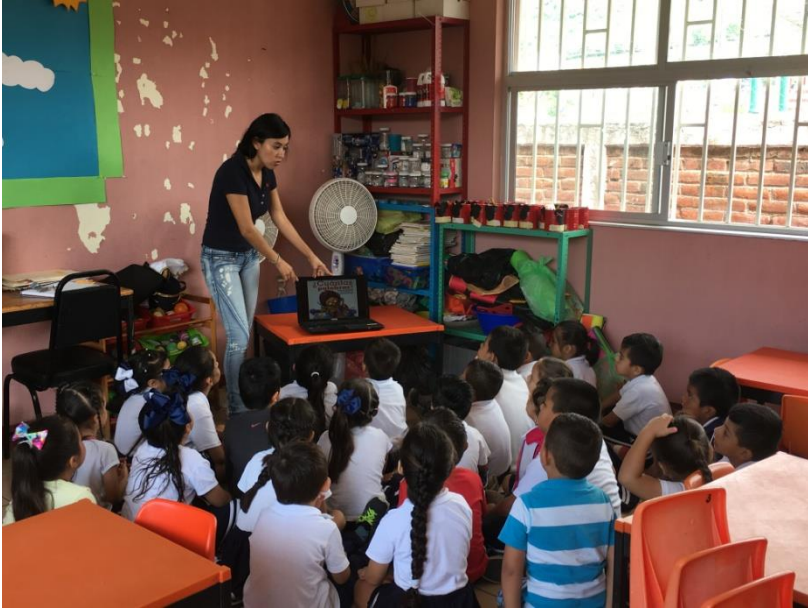
CUENTO "CUANTAS PALABRAS"