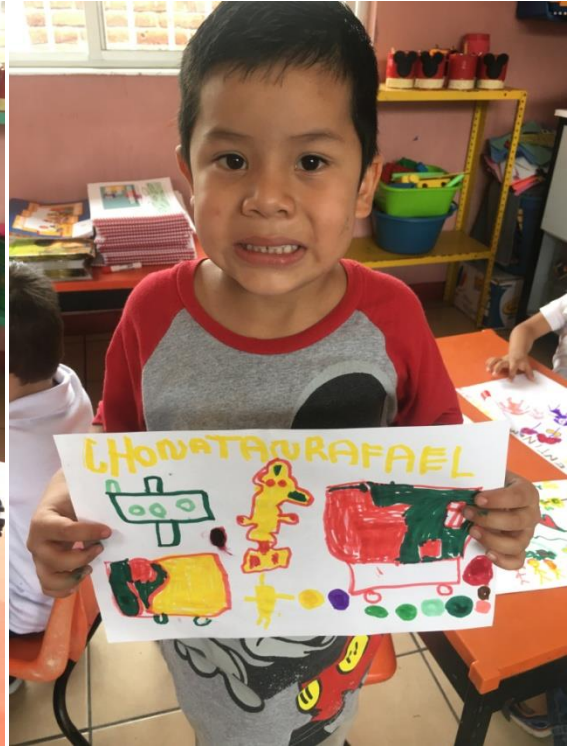
ESCRITURA DEL NOMBRE CON PLUMONES DE COLORES