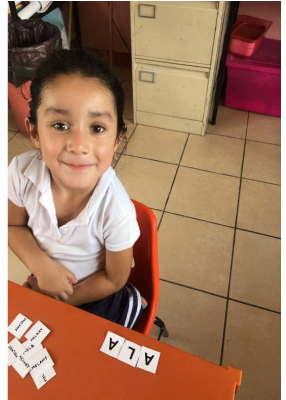
FORMACIÓN DE OTRAS PALABRAS CON LAS LETRAS QUE COMPONEN SU NOMBRE