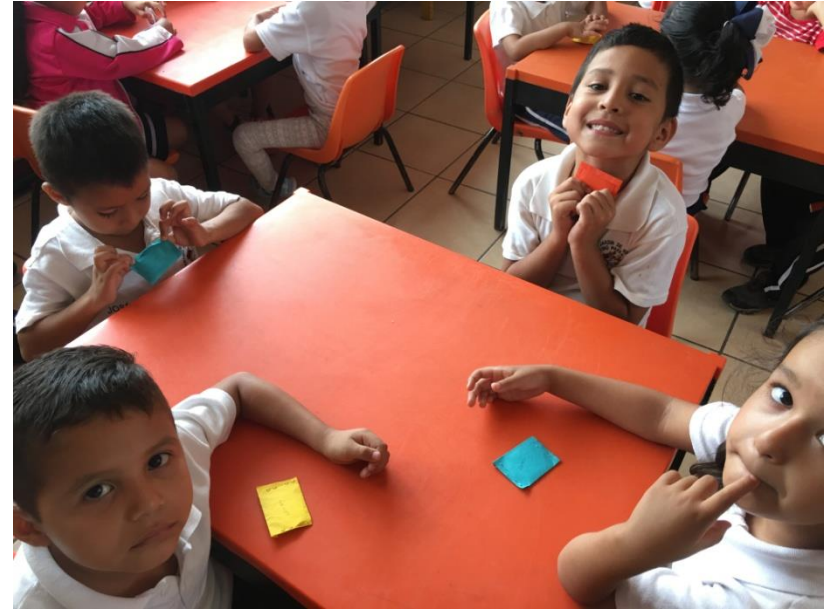
ENTREGA DE SOBRES CON LETRAS DE SU NOMBRE (ALFABETO MOVIL)